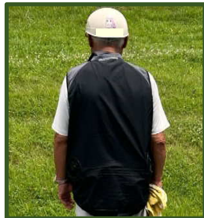
【購入した空調服の写真】

A5.熱中症リスク低減のため、空調服の購入は以前から考えていました。補助金の活用により高年齢者34人分の空調服の購入費用を半分に抑えることができました。補助金が無ければ、空調服の購入はしていなかったかもしれません。